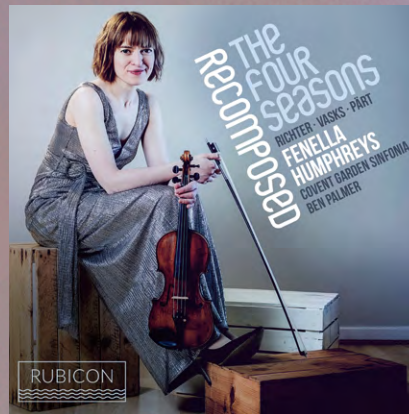
Recomposed Richter · Vasks · Pärt Covent Garden Sinfonia / Ben Palmer